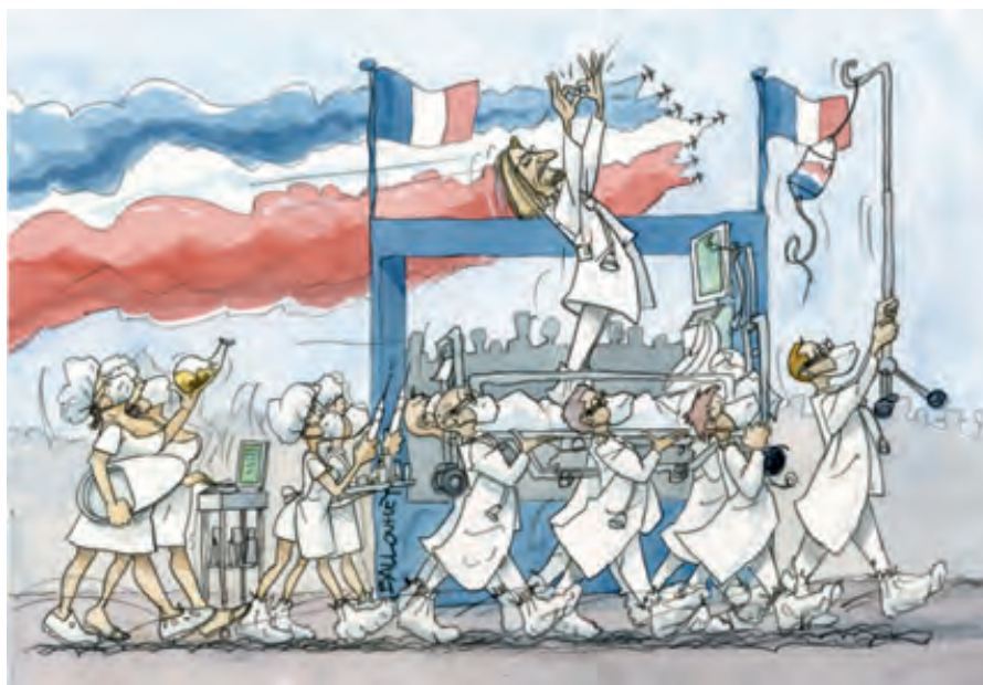
FIGURA 2. Estereotips de gènere

En aquesta vinyeta de Pierre Ballouhey (França), els doctors (tot homes) caminen al capdavant d'una desfilada amb pacients, mentre que les infermeres i els seus assistents (tot dones) els segueixen, vestint minifaldilles, i perpetuant estereotips de gènere.